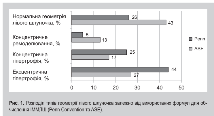
Рис. 1. Розподіл типів геометрії лівого шлуночка залежно від використаних формул для обчислення ІММЛШ (Penn Convention та ASE).

При розрахунку індексу маси міокарда ЛШ за формулою Penn Convention нормальну геометрію лівого шлуночка мали 26 (26 %), концентричне ремоделювання – 5 (5 %), концентричну гіпертрофію – 25 (25 %) та ексцентричну гіпертрофію – 44 (44 %) хворих на ГХ. Розрахунок індексу маси міокарда за формулою ASE дав можливість отримати такі типи геометрії лівого шлуночка в тих самих хворих: нормальну геометрію лівого шлуночка мали 43 (43 %), концентричне ремоделювання – 13 (13 %), концентричну гіпертрофію – 17 (17 %) та ексцентричну гіпертрофію – 27 (27 %) хворих. Індекс маси міокарда ЛШ при використанні формули Penn Convention становив 116,48 \pm 34,12 \text{ г/м}^2 , а при