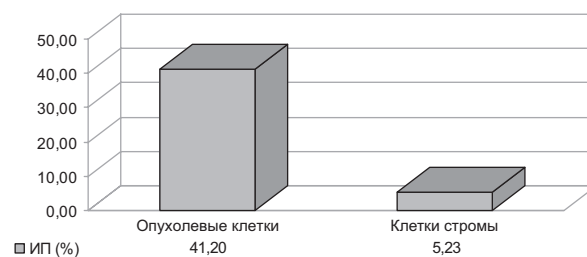
Рис. 3. Значение индекса пролиферации опухолевых и стромальных клеток колоректальной аденокарциномы ( p < 0,05 ).

При иммуногистохимическом исследовании положительное иммуноокрашивание ядер выявлялось как в собственно опухолевых, так и в стромальных клетках колоректальной аденокарциномы. Медиана ИП опухолевых клеток колоректальной аденокарциномы составила 41,20 % (36,62; 59,42), медиана ИП клеток стромы – 5,23 % (4,72; 6,45). Разница между полученными показателями статистически значима ( p < 0,05 ). Таким образом, установлено: опухолевые клетки колоректальной аденокарциномы характеризуются средним уровнем экспрессии Ki-67, а клетки стромы – низким (рис. 3).